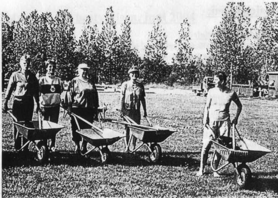
Trillebørshæren er kampklar. Nu gælder det forårsrengøringen!

Vi har fået en købmand med skub i. For at vi skal starte dagen med klart hoved, vil der resten af sommeren, hver dag være gratis kaffe og avislæsning, mellem kl. 8 og 11.